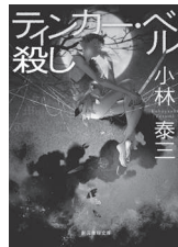
เล่ม 4 ฆ่าทิงเกอร์เบลล์