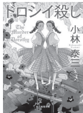
เล่ม 3 ฆ่าโดโรธี